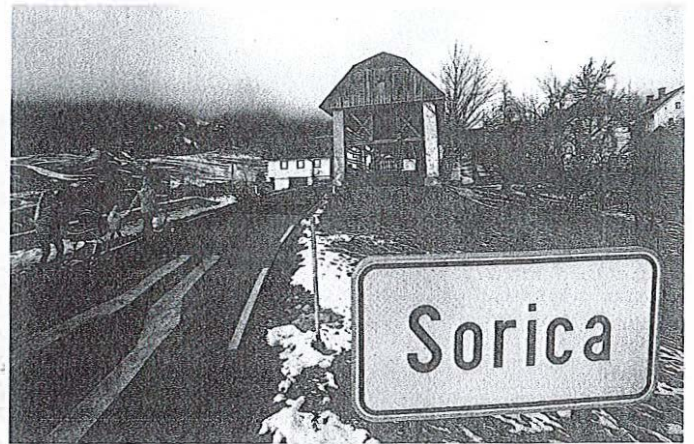
V Sorici upajo, da bo prevoznik Arriva v najkrajšem možnem času znova vzpostavil prvotni urnik avtobusnih prevozov.

Pintar je tudi povedal, da je Sorica z javnim prevozom