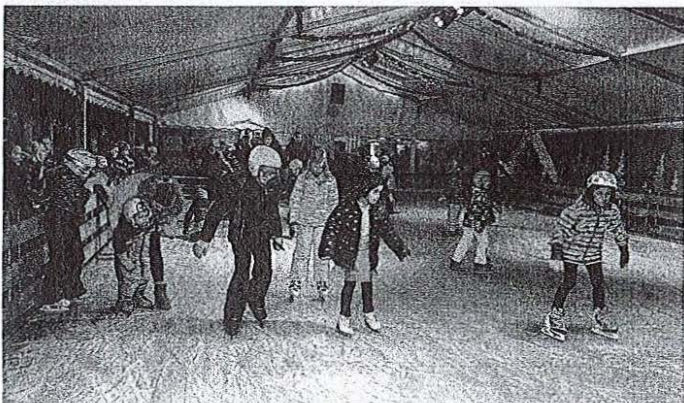
Otroci so si rade volje nadeli drsalke.