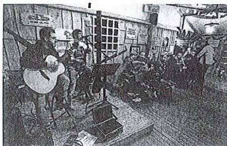
Z glasbo je drsanje, druženje in okrepčilo popestril duet Planet Acoustic.

napovedal, da bodo med 20. in 23. decembrom organizirali slukanje z Božičkom.