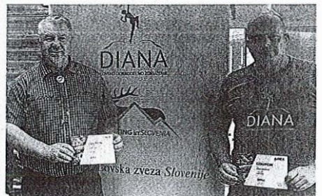
Člani Lovskega dobrodelnega združenja Diana pomagajo prizadetim v avgustovskih poplavah.