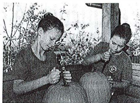
Rezljanja buč so se lotili številni otroci. / Foto: Peter Košenina

Noč čarownic na Starem gradu je bila sprva namenjena le otrokom iz okoliških