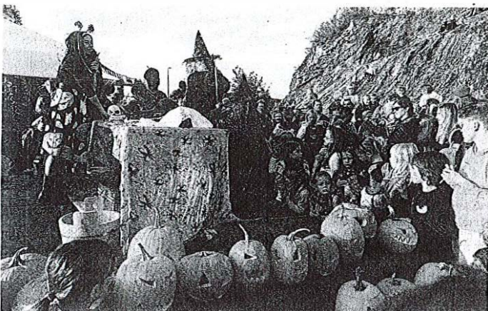
Že lanska, prva Noč čarownic na Starem gradu je bila dobro obiskana, letos pa je bilo obiskovalcev še več.

vasi, a je že v prvi izvedbi privabila več sto ljudi. Letošnji obisk je bil še boljši, saj je bil prostor pod Starim gradom skoraj povsem poln.