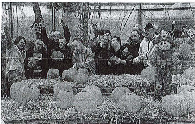
Po buče so se v Spodnje Piričice pripeljali iz Višnje Gore.