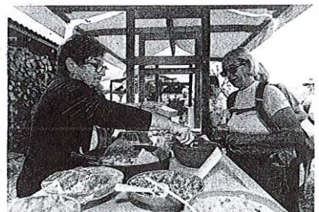
Največji dogodek društva je Slovenski dan v Dragočajni, ki je v nedeljo na pokušino domačih jedi privabil veliko obiskovalcev.