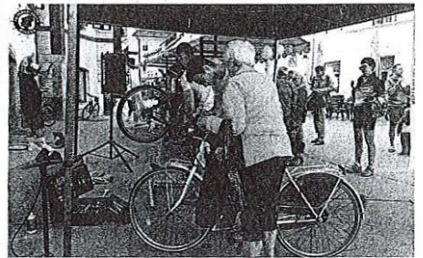
Poleg malice so za kolesarje pripravili tudi pregled in servis koles.

»Za vse mimoidoče, posebno kolesarje, smo pripravili presenečenje, saj smo jim danes ponudili malico. Prav tako smo pripravili promocijski material s področja prometne varnosti. Predstavljamo eKOLoko, vsak, ki želi, lahko obišče tudi servis koles in preveri, kako varno kolo ima oziroma mu stro-