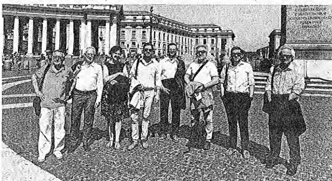
Na srečanju v Vatikanu / Foto: arhiv Andreje Megušar

»Pravzaprav je šlo za prvo uradno srečanje med predstavniki Vatikanu in Europassiona, ki predstavlja devetdeset evropskih mest in množico prostovoljcev, ki uprizarjajo to dediščino,« je še dodala Ravnihar Megušarjeva.