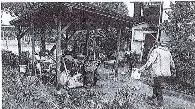
Poplavljeni so bili številni objekti. Ko je voda odtekla, so ljudje iz stanovanj začeli odnašati opremo in odstranjevati blato, ki ga je voda pustila za seboj.

Medvode so poplave močno prizadele. Začelo se je že v zgodnjih petkovih urah. »Prve intervencije so bile v vaseh pod Polhograjski (Rakovnik, Vaše, Goričane, Preska, Sora), čez njo se je kot zelo problematično pokazalo območje doline Ločnice tudi s plazovi, zjutraj pa je sledilo zelo hitro naraščanje Sore, ki je zalila središče Medvod. Kasneje je zalilo še območje Vikrc, kjer tako visoke vode prav tako nihče ne pomni. Dvignil se je tudi nivo podtalnice, tako da je tudi tam, kjer niso bili neposredno ogroženi od vodotokov, začelo zalivati kleti, kar pomeni tudi območje KS Smednik in Zbilje, kjer so imeli veliko dela s črpanjem vode. Včeraj smo v prvi vrsti reševali življenja,« je poudaril Smole. Vse skupaj je potekalo zelo hitro. »Sodelavci iz občinske uprave so iz stavbe tekli, ko jim je voda segala že do kolen. Ta sila vode, ki je včeraj pokazala svojo moč, je bila res neverjetna,« je slikovito ponazoril. Smrtnih žrtev k sreči ni bilo, reševanje je potekalo tudi s čolni. Eno na takšen način s polja pod Rakovnikom, ko so rešili dve osebi, ki sta bili sredi deroča vode ujeti v avtomodu. Potrebna je bila tudi evakuacija nekaterih prebivalcev v športno dvorano Medvode, kjer so registrirali 60 ljudi.