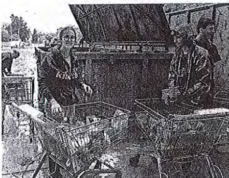
Zalilo je tudi blagovni center. Iz Mercatorja so v kontejnerje vozili izdelke, ki so bili pod vodo. Kot prostovoljci so pomagali tudi medvoški taborniki.

Vse dni so se v športni dvorani Medvode vodstvo intervencije Poplave 2023 in vodstva interventnih ekip sestajali na koordinacijah. Delo poteka usklajeno. Včeraj popoldan je potekala tudi izredna seja občinskega sveta, na kateri so se svetniki seznanili z razmerami po poplavih. Začenja se sanacija, ki bo dolgotrajna. Škoda je velika. »Niti slučajno si ne morem predstavljati, kako bomo zagotovili sredstva za sanacijo vseh poškodb, ki so nastale na javni infrastrukturi, za sanacijo vseh plazov ... Glavna skrb je trenutno, kako zagotoviti, da se bodo ljudje lahko vrnili na svoje domove, da se bodo vsaj za silo, če bo le šlo, pripeljali do svojih hiš. Nato bomo teden za tednom stvari reševali naprej,« je v soboto še pojasnil župan.