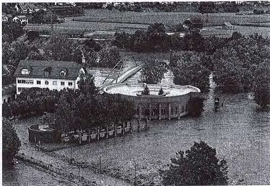
Poplavljeno središče Medvod na sotočju Sore (spodaj), ki je narasla do vrha mostu in čez, in Save, kjer je prvo težko preizkušnje preživila nova brv (zgoraj). Poplavilo je vse stavbe, kot po čudežu pa so ostali suhi prostori Knjižnice Medvode (desno).

Ogrožena so bila življenja, premoženje in infrastruktura. Več sto ljudi je bilo evakuiranih, ujma je poškodovala številne ceste in odnesla mostove, zaradi česar so bili ponekod odrezani od sveta. Poplave so povzročile kaljenje vodnih virov, več krajev je ostalo brez elektrike. Neurja so terjala tudi smrtne žrtve.