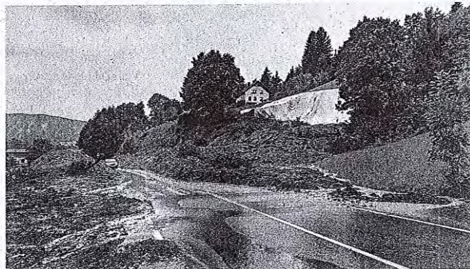
Največjo grožnjo trenutno predstavljajo plazovi.

zagotovo še bistveno naraslo,« je dodal Kodrič. Kranjski regijski center za obveščanje je največ klicev prejel iz občin Škofja Loka (750), Kranj (350), Cerklje (340), Gorenja vas - Poljane (216) in Radovljica (194). »Skupaj so enote posredovale na 2246 lokacijah v gorenjski regiji, a kot že rečeno, bo število še višje,« je še dodal Kodrič.