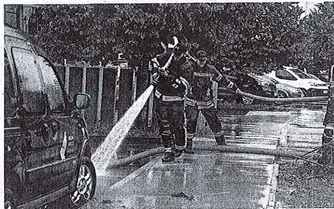
Na terenu je skupaj sodelovalo več kot 3500 gasilcev.

V soboto je število klicev padlo na 500, v nedeljo na 300. Do ponedeljka dopoldan so zabeležili največ klicev zaradi poplave meteorne vode (1320), poplave ob vodotokih (650) in plazov (170). »Evidentiranje dogodkov še poteka, zato bo število