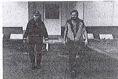
Policisti so sodelovali tudi pri evakuaciji ljudi in varovanju premoženja.