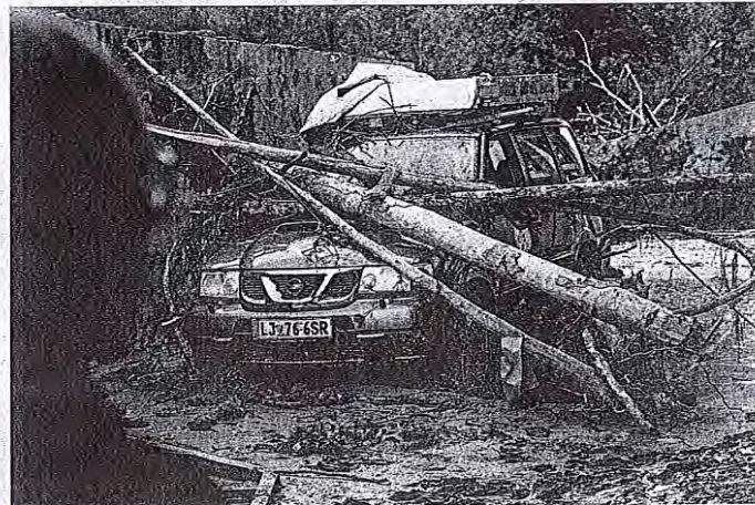
Slovenijo je pretekli konec tedna opustošila najhujša naravna katastrofa doslej, ki je poškodovala tako zasebno kot javno lastnino.