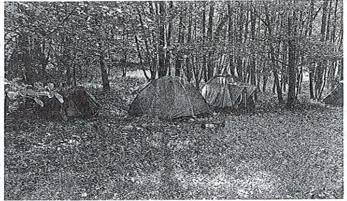
Nedovoljeno kampiranje in prenočevanje v času poletne sezone postaja obremenjujoče tako za okolje kot tudi za prebivalce. Fotografija je simbolična.