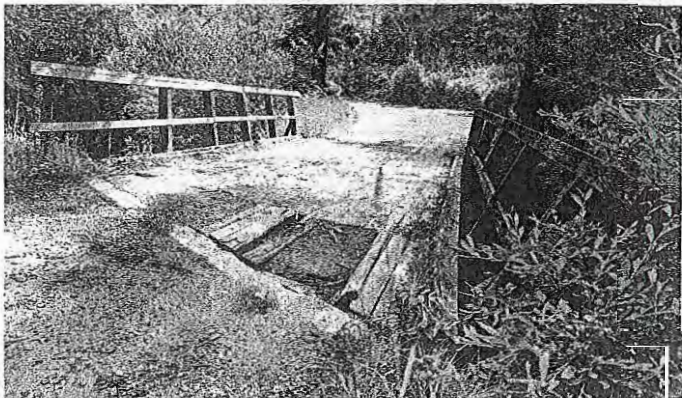
Dotrajani Kovkov most

Jezersko – Julnov most čez Reko v občini Jezersko je ravno na takem območju, da se čezenj steka ves promet iz doline Reke. Gre za območje sečnje Kozji vrh, Podstoržič, Dol. Njegova obnova se je začela s sanacijo opornih zidov v lanskem letu in nadaljevala z izgradnjo talnega praga marca letos, v naslednjem letu pa občina skupaj z družbo Slovenski državni gozdovi (SIDG) načrtuje še prenovo vozišča in ograje. Projekt bosta sofinancirala oba omenjena deležnika. Za Kovkov most, ki stoji naprej od Julnovega, pa so ob vseh podražitvah na občini že mislili, da obnova ne bo izvedljiva. Potem je občina pri lokalnih izvajalcih poizvedela, kdo bi lahko izpeljal kateri del obnove, kar se je izkazalo