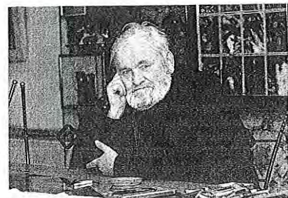
Tomaž Kržišnik

Umrli je slikar, oblikovalec, scenograf in likovni pedagog Tomaž Kržišnik, bil je tako žirovski kot slovenski umetnik. S svojimi deli je že v sedemdesetih inovativno zaznamoval slovensko likovno sceno, veliko ustvarjalnih in trajnih sledi pa je zapustil tudi v domačem kraju. Rodil se je 9. februarja 1943 v Zireh. Študiral je na Akademiji lepih umetnosti v Varšavi in na njej leta 1968 magistriral. Po prvni leti v letih 1973–1976 učil na Šoli za oblikovanje v Ljubljani, od 1988 pa na Oddelku za oblikovanje Akademije za likovno umetnost v Ljubljani, kjer je bil izvoljen v naziv rednega profesorja in se leta 2008 upokojil. Med obema pedagoškima obdobjema je deloval kot svobodni umetnik. Umrli je v domu starejših občanov v Zireh 22. maja 2023.