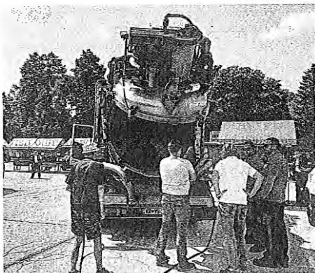
Predstavitve vozila za čiščenje kanalizacije

bil škodljiv za naravo. Prav zaradi tega ga gospodinjstva v Sloveniji najpogosteje nepravilno odlagajo, in sicer tako, da ga zlijajo v kuhinjsko korito ali straniščno školjko in s tem v javni kanalizacijski sistem. S tem ne tvegajo samo tega, da bi v svoj kanalizacijski sistem pricali različne škodljivce ali tvegali njegovo zamašitev, temveč lahko povzročijo onesnaženje površinskih voda in podtalnice. Po strokovnih ocenah lahko en liter odpadnega olja onesnaži kar tisoč litrov vode. To pa je količina vode, ki jo povprečen odrasel Evropejec porabi v petih dneh.