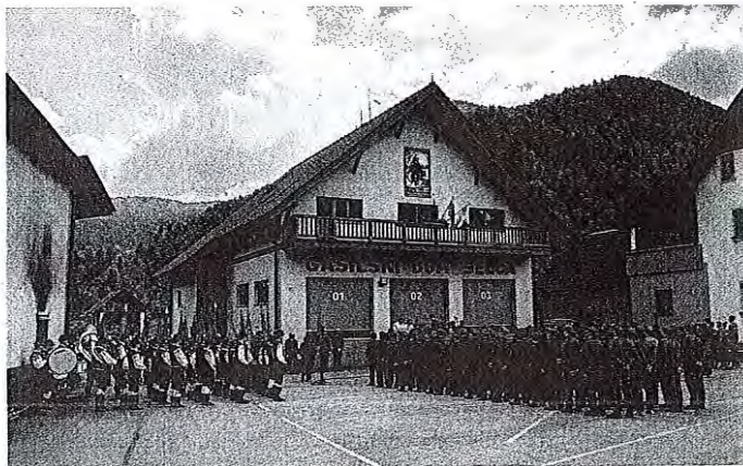
Za nov gasilski dom so si selški gasilci prizadevali vrsto let.