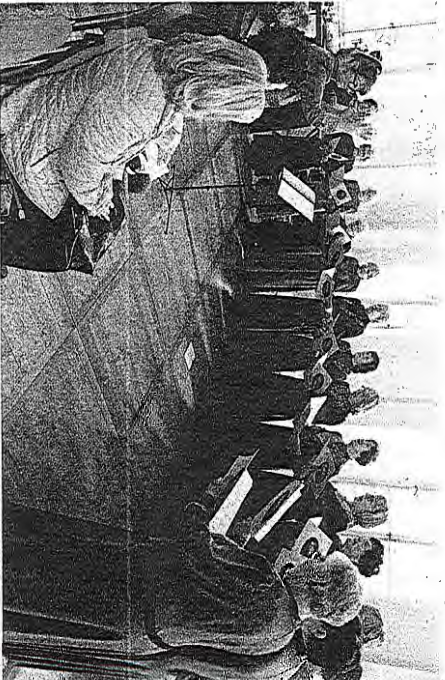
Tradicionalno revijo pevskih zborov Gorenjski upokojenci pojejo 2023 je Pokrajinska mreža društev upokojencev Gorenjske pripravila v Radovljici.

Pri tem je poudarila, da glavni namen sobotne revije ni bil tekmovalen. »Resnično gojimo veliko spoštovanje do ljudi, ki zavzeto in vestno pojejo tudi v obdobju, ko niso več službeno aktivni. Koliko lepša jim lahko prinaša petje. Nekateri pojejo že vse življenje, nekateri se priključijo kasneje, vsaka