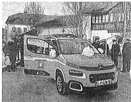
Gasilska zveza Medvode je dobila prvo poveljniško vozilo.

Do sedaj Gasilska zveza Medvode svojega vozila ni imela in vse naloge opravljajo javne gasilske službe so funkcionarji v zelo veliki večini opravljali s svojimi vozili.