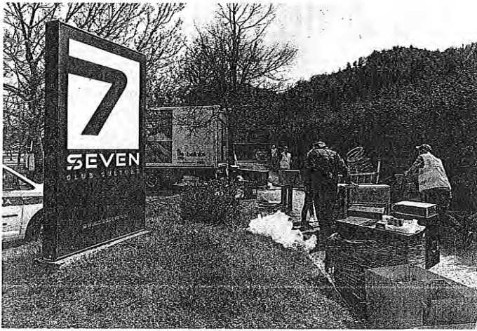
Zarubljeno premično premoženje bodo prodali na javni dražbi.