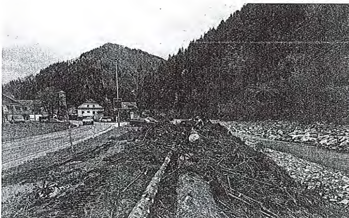
Gradnja železnikarske obvoznice se je začela na lokaciji v bližini nogometnega igrišča, kjer bo eden od dveh priključkov na obstoječo regionalno cesto.

Železniki – Potem ko je Direkcija RS za infrastrukturo (DRSI) in Občina Železniki konec februarja uspelo skleniti dogovor s pritožnico, ki je vložila pritožbo na izdano gradbeno dovoljenje za gradnjo obvoznice v Železnikih, se je ta predčerašnjim, ko je gradbeno dovoljenje postalo pravomočno, vendarle začela. V Selški dolini na obvoznico težko čakajo že vrsto let, saj so prometne razmere na regionalni cesti skozi ožino v starem trškem jedru Železnikov nevdružne.