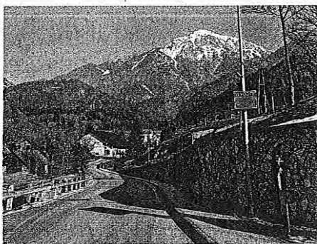
Merilnik hitrosti sedaj prehitre voznike opozarja ob vstopu v vas Bašelj.

Prestavitev prikazovalnikov hitrosti se opravi na podlagi pobud občanov ali članov odbora Sveta za preventivo in vzgojo v cestnem prometu, je nadaljeval Murnik. Pri Osnovni šoli Matije Valjavca Preddvor je prikazovalnik hitrosti tako za-