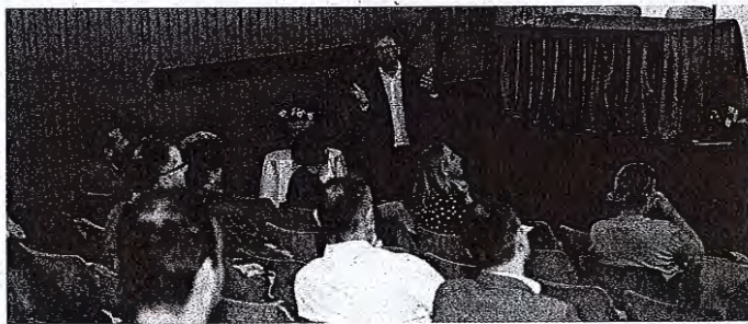
Srečanje predstavnikov medvoškega gospodarstva / Foto: Aleš Senozetnik

Medvode – Na povabilo župana Nejca Smoleta se je v sredo v medvoškem kulturnem domu zbralo kakšnih 15 predstavnikov največjih medvoških gospodarskih družb. Na srečanju, ki je potekalo prvič po letu 2018, je župan zbranim predstavil v minulem mandatu izvedene projekte ter načrtovane investicije v prihodnjih letih. Največ razprave je vzbudilo dolgotrajno umeščanje v prostor. Občina je namreč v fazi sprememb in dopolnitev občinskega prostorskega načrta, a so tako župan kot nekateri izmed prisotnih gospodarstvenikov potarnali, da postopki trajajo predolgo. Pri