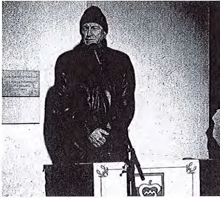
Slavnostni govornik na slovesnosti na Sv. Jakobu je bil nekdanji predsednik RS Borut Pahor.

Slavnostni govornik je bil nekdanji predsednik Republike Slovenije Borut Pahor. Poudaril je pomen političnega sodelovanja in dogovarjanja za uveljavljanje temeljnih stremiljenj Slovencev – v plebiscitnem času leta 1990, danes in v prihodnje. Kot je povedal, razlike niso problem, če je dovolj volje za