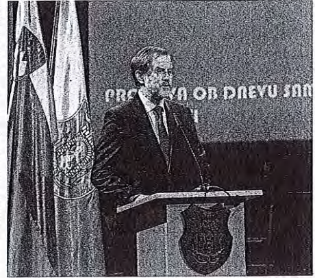
Lojze Peterle, slavnostni govornik na prireditvi

Demosovim programom samostojne Slovenije in nadaljevanjem poti v morda nekoliko spremenjeni Jugoslaviji. »Menim, da ne bi imeli plebiscita, če ne bi takrat, tudi s pomočjo domoljubov in demokratov v Kamniku,