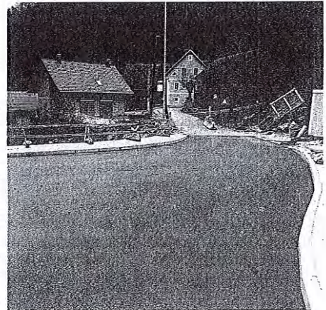
Novi most na Fužinah

meter in pol dolgega odseka državne ceste Trebija–Sovodenj, so pojasnili na Občini Gorenja vas - Poljane. »Stari most na Fužinah je bil namreč že povsem dotrajan in tehnično neustrezen, zato so ga letos marca porušili in na njegovem