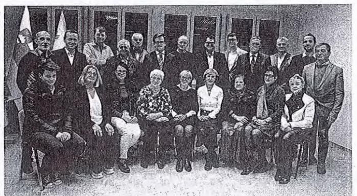
Medvoški občinski svetniki z županom na konstitutivni seji