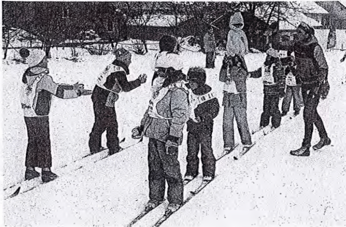
Teka na smučeh se lahko učimo tudi skozi igro. Petra Majdič je predstavila veliko različnih in zanimivih idej.

Teka na smučeh so se učili predvsem skozi igro, njihova učiteljica pa je bila tudi nekdanja vrhunška smučarska tekačica Petra Majdič, ki je ena izmed ambasadorjev akcije. »Takšno delo mi je v užitek, kot opazam, pa je tudi nujno potrebno. Kar nekaj otrok je bilo danes sploh prvič na smučeh. Vidi se pomanjkanje gibanja s smučmi, motorike, koordinacije. Med udeleženci je velika razlika. Super je, da nam jo je uspelo vsaj nekoliko zmanjšati. Želimo jim približati zimске radosti. Smučarski tek jemljem kot preprosto gibanje v naravi, ki je za človeka precej naravno, sploh klasična tehnika. Videti je, da se na tekaških smučeh otroci počutijo svobodno in jim je všeč. V teh nekaj urah se jih da naučiti veliko,« je povedala Petra Majdič. Otroci so bili navdušeni. »Vseč mi je in je zabavno. Naučila