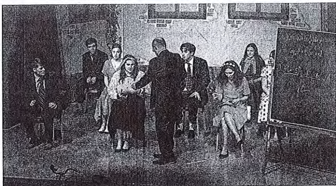
Dijaki se najbolj bojuje izpita iz matematike.

Film so za gledališče priredili mladi gledališčniki sami. »Iskali smo predstavo, ki bi jo v letu 2022 še lahko izvedli. Nismo hoteli še ene klasike, ki je bila že