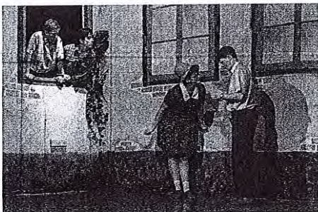
V igri Vesna se predstavljajo mlajši igralci KUD Oton Župančič iz Sore.

prostorih smo pripravili dvignjen oder, dogajanje zunaj ima dvizžno ozadje, del predstave poteka na balkonu dvorane, del pa v parterju. Pod stropom visi