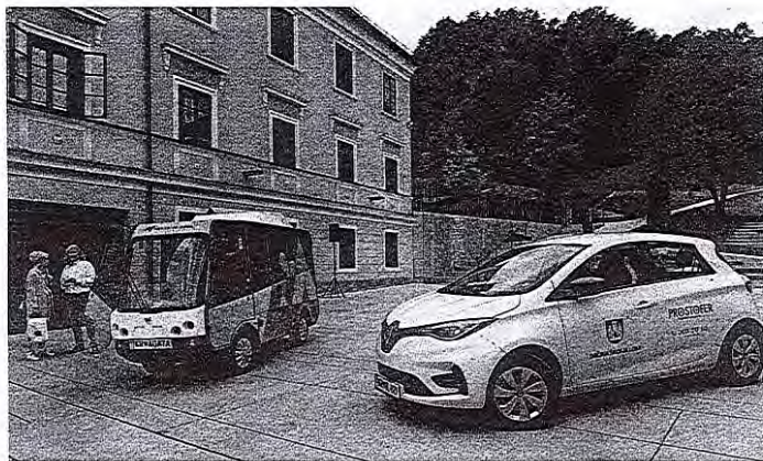
Prostofer je poleg brezplačnih minibusov Jurija in Agate velika pomoč zlasti za starejše, ki nimajo lastnega prevoza.

»S prostoferstvom nam je uspelo povečati udeležbo starejših v cestnem prometu in hkrati izboljšati njihovo mobilnost. S tem, ko manj