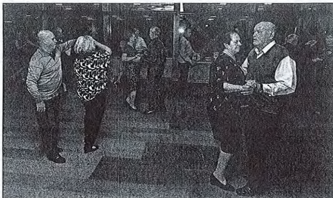
Na plesišču se je zavrtelo kar nekaj parov, ki se niso ozirali na okolico, temveč so se prepustili zvokom dobre glasbe.

Kot je pojasnila, družabni plesni večeri potekajo že 21 let, vendar so bili zaradi epidemije prisiljeni za dve leti prekiniti druženja. »Zelo me veseli, da smo se končno spet zbrali z namenom dobrega druženja, ki ga bomo popestrili z ritmi zimzelenih skladb in popleševanjem v parih,« je pojasnila Puharjeva in dodala,