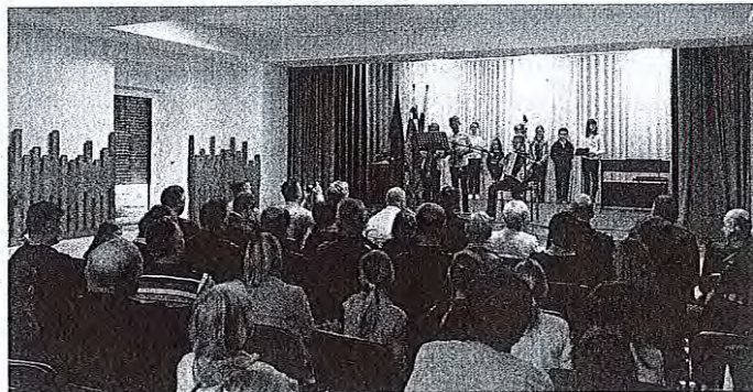
V prenovljeni dvorani so na oder stopili tudi otroci.