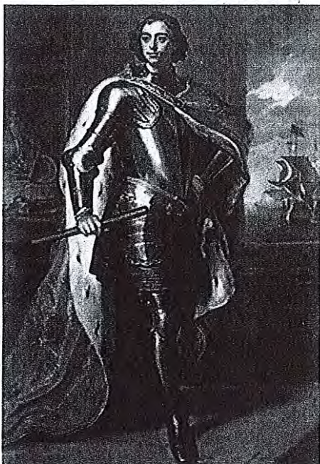
Ruski car Peter I. Romanov

Ukrajinski zgodovinar Oleg Subtelny, ki sicer živi v Kanadi (kjer je naseljeno mnogo Ukrajincev), pravi takole: »Zgodovina Hetmanata je postala ključni del nacionalne zgodovine in mita o ustvarjanju nacije. Samovladanje, ki se je tam začelo, je pomagalo ustvariti težnje modernih Ukrajincev za lastno državo.« (Konec)