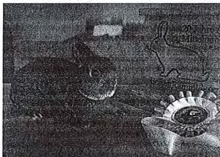
Najlepši kuncец z mednarodne razstave v Arriachu v Avstriji

Ločniškar kuncce goji že od leta 1978, leto kasneje je naredil izpit za sodnika za ocenjevanje kunccev. Trenutno