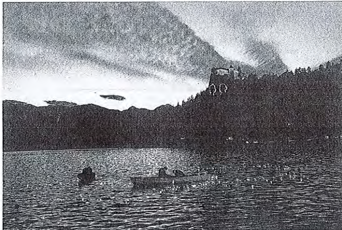
Na gladini Blejskega jezera je v spomin na kraljico zagorelo petsto lučk.