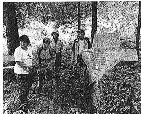
Polaganje venca pri spomeniku padlim borcem