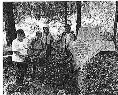
Polaganje venca pri spomeniku padlim borcem