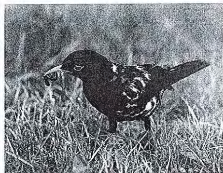
Črno-beli kos je nosil hrano v gnezdo, od koder je kasneje odletel en sam mladič, povsem normalno črno obarvan.