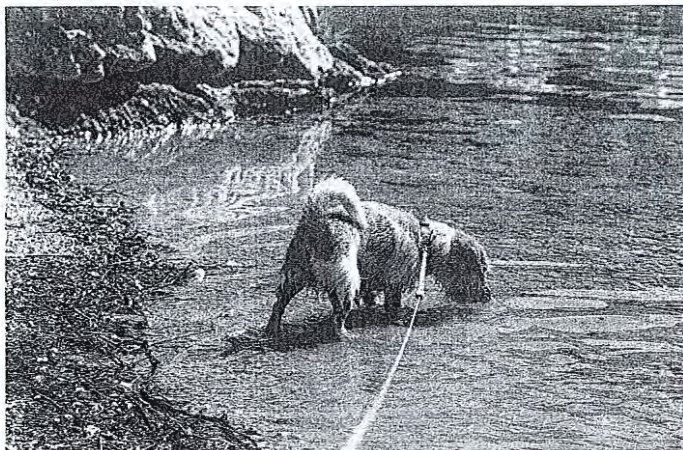
Živali velike temperaturne obremenitve občutijo veliko bolj kot ljudje, saj se težje ohlajajo.

Zlata Čop, doktorica veterinarske medicine z Veterinarske klinike Lesce, poudarja: »Za živali smo odgovorni in dolžnost vsakega človeka je dobrobit njegovega ljubljence. Živali velike temperaturne obremenitve občutijo veliko bolj kot ljudje, saj se težje ohlajajo. Trenutne temperature jim ne ustrezajo, zato je bistvenega pomena, da jim zagotovimo zadostno količino vode in senco. Seveda zaradi sušnega obdobja vodo iščejo