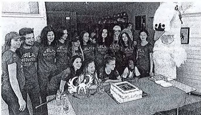
Mladinke PGD Zbilje so se na gasilsko olimpijado vestno pripravljale zadnji dve leti.