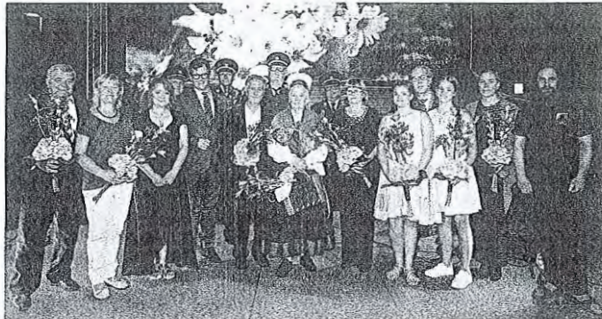
Letošnji občinski nagradenci v Medvodah