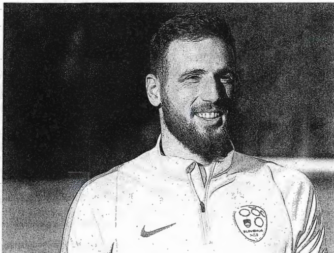
Jan Oblak bo od konca tega meseca častni občan Škofje Loke.

Srebrni grb Občine Škofja Loka si je za prizadevno