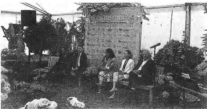
Pestro kulturno dogajanje na festivalu so organizatorji napovedali in predstavili na novinarski konferenci.

Volčji Potok – Teden ljubiteljske kulture se bo letos prvič sklenil z velikim dogodkom, festivalom, na katerem se bo hkrati predstavilo okoli 1500 ljubiteljev kulture. Arboretum bo v soboto, 18. junija, gostil ljubiteljske godbe, pevske zборе, gledališnike, lutkarje, plesalce, pisce, slikarje in druge umetnike. »Do sedaj se še ni zgodilo, da bi se vse kulturne panoge v enem dnevu hkrati predstavile na sedmih velikih odrih, zraven pa smo povabili še panožne zveze, kot so ribiči, reševalci in gorski reševalci, planinci, gasilci, čebelarji, lovci ..., ki bodo svoje dejavnosti predstavili otrokom, saj menimo, da so zelo pomembni za našo družbo, za kakovost naših življenj,«