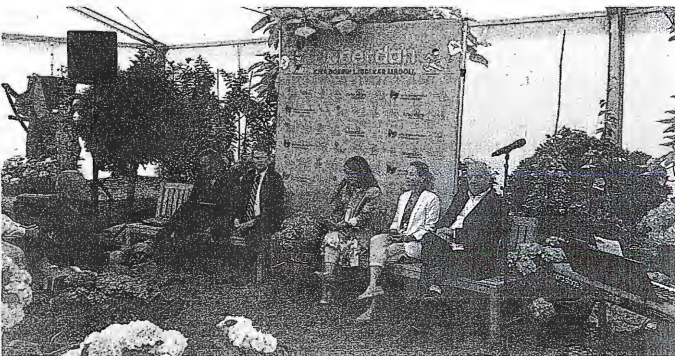
Pestro kulturno dogajanje na festivalu so organizatorji napovedali in predstavili na novinarski konferenci.

Volčji Potok – Teden ljubiteljske kulture se bo letos prvič sklenil z velikim dogodkom, festivalom, na katerem se bo hkrati predstavilo okoli 1500 ljubiteljev kulture. Arboretum bo v soboto, 18. junija, gostil ljubiteljske godbe, pevske zборе, gledališčne, lutkarje, plesalce, pisce, slikarje in druge umetnike. »Do sedaj se še ni zgodilo, da bi se vse kulturne panoge v enem dnevu hkrati predstavile na sedmih velikih odrih, zraven pa smo povabili še panožne zveze, kot so ribiči, reševalci in gorski reševalci, planinci, gasilci, čebelarji, lovci ..., ki bodo svoje dejavnosti predstavili otrokom, saj menimo, da so zelo pomembni za našo družbo, za kakovost naših življenj,«