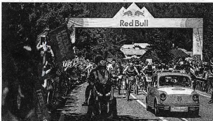
Začetek tekmne je spremljal tudi legendarni fičo