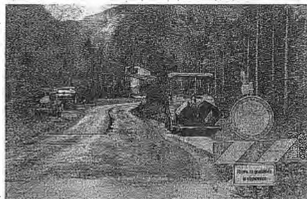
Država je daljši odsek ceste na Črnivec na novo preplastila tik pred prvomajskimi prazniki.

vse do 31. maja. Po prenovi bo prvih pet kilometrov ceste v dolini povsem brez lukenj, česar se bodo verjetno najbolj razveselili kolesarji, ki si prelaz Črnivecradi izbirajo za svoj cilj, na občini pa si želijo, da bi država uresničila tudi dogovore o asfaltiranju še preostalih dotrajanih odsekov proti vrhu prelaza. Po dolini Črne in po odseku Kranjski Rak–Rakove ravni, ki ga bo občina prav tako v kratkem asfaltirala, se bodo 18. junija podali tudi tekmovalci na četrti etapi kolesarske dirke Po Sloveniji.