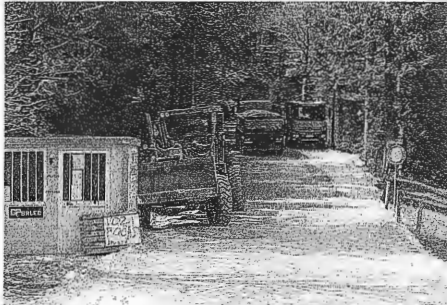
Na planino je bilo treba pripeljati približno sto tovornjakov asfalta.