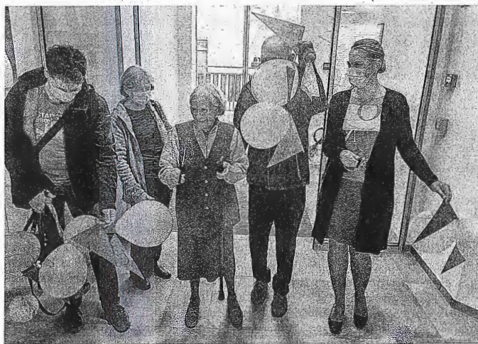
Presenečenje za prvo stanovalko v Domu starejših SeneCura Žiri