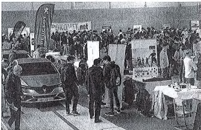
Na srečanju se je predstavilo 45 delodajalcev in predstavnikov gospodarske in obrtne zbornice Slovenije.

Na srečanju se je predstavilo 45 delodajalcev in predstavnikov gospodarske ter obrtne zbornice Slovenije. Po besedah Šmelcerjeve je običajno največji delež njihovih vajencev v škofoškem podjetju LTH Castings. »Sprva smo sprejeli osem vajencev, letos jih načrtujemo že deset. Podjetje