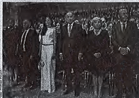
Zaključna konvencija Slovenske demokratske stranke

Podporo SDS in Janši sta izrazila tudi prisotni vodja poslanske skupine Evropske ljudske stranke v Evropskem parlamentu Manfred Weber in v video nagovoru poljski