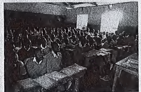
V vasi osemletko obiskuje 545 otrok, zanje skrbi devet učiteljev. Razredi so izjemno polni, saj je v njih od 50 do 92 otrok.

Kot poudari, je v preteklosti večkrat naletela na očitke, da Afriko opisuje preveč romantično. »Morda bi ljudje res lahko naredili več, da bi se otresli oklepa revščine, morda smo mi bolj delovni in disciplinirani ter v življenju iščemo manj bližnjic. Smo pa zato veliko manj sproščeni in manj povezani. V gonji za lastnimi dosežki smo pozabili vzeti s sabo ljudi. Formalizirali smo vjudnostne pozdrave ali pa kar hitro drug mimo drugega brez njih. Tudi v vas so prišli mobiteli in nekatere moderne dobrine. Vrednote pa k sreči za zdaj ostajajo njihove. Občutek skupnosti je v vasi še vedno neverjeten. Prijazen in topel, nasmejan pozdrav je temeljni del kulture, ne glede na sorodstvene, socialne ali profesionalne vezi. 'Živijo, brat, kako si, kam greš?' je slišati na vsakem koraku in v vasi je nemogoče, da ne bi