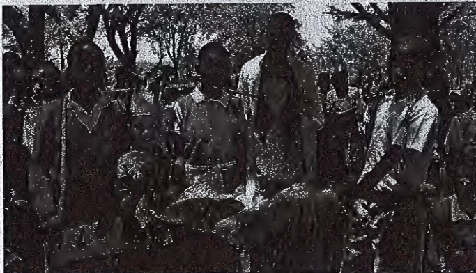
Starejša otroka sta solarja. Brez težav sta se vživela v dogajanje v vasi in sproščeno uživala vsak trenutek.

na poti večkrat postal in kogarkoli že na daleč pozdravil z glasnim, nasmejanim 'Dober dan, kako gre?' Po kratkem klepetu se pot nadaljuje s še enim prijatnim trenutkom v dnevu več. Nanizani prijazni in iskreni pozdravi naredijo neznanega razliko v splošnem vzdušju in vli-vajo občutek varnosti in pripadnosti. Ljudje skrbijo drug za drugega in so veliko bolj prepleteni med sabo kot pri nas. To je afriški »hakuna matata«, ki ne bi škodil tudi nam. Ne pomeni, da ni problemov, ampak da so ti lažji in premagljivi, dokler imamo drug drugega, smo del večje skupnosti in živimo dobro to svoje edino življenje,« je zaključila.