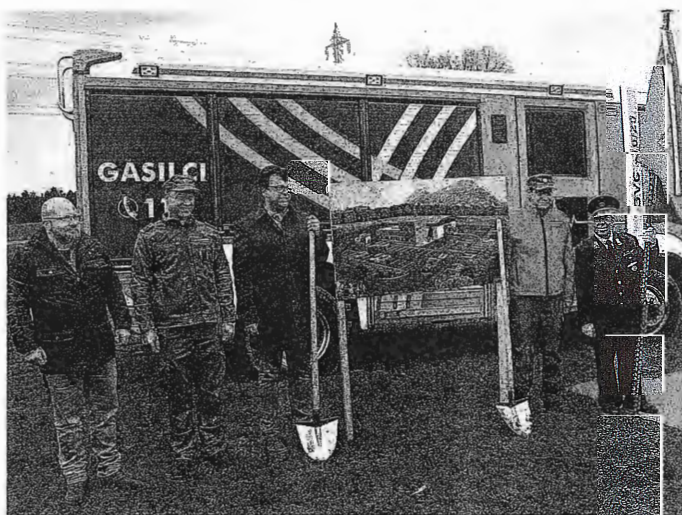
Zasadili so lopate za novi gasilski dom in predstavili njegov videz.