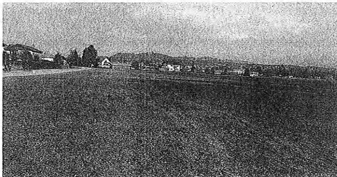
Gradnja Osnovne šole Preska bo potekala na novi lokaciji – v neposredni bližini Osemenjevalnega centra Preska.

»Resneje smo možne rešitve začeli presojati šele, ko je bil leta 2018 sprejet Občinski prostorski načrt Občine Medvode, ki je tam spremenil del kmetijskega zemljišča v zazidljivo zemljišče za namen izobraževalnih dejavnosti. To zemljišče je bilo prej v lasti Republike Slovenije, ko je postalo zazidljivo, se je izpolnil pogoj, da se lahko brezplačno prenese na občino, ki je tako postala lastnica okrog 13 tisoč kvadratnih metrov zazidljivih površin,« je pojasnila Katja Gomboši Telban z Občine Medvode. Po predlaganem terminskem planu so letos predvidene izdelava projektno dokumentacije, pridobitev gradbenega dovoljenja in izvedba postopka javnega naročila, gradnja naj bi se začela prihodnje leto in se zaključila v letu 2024, ko naj