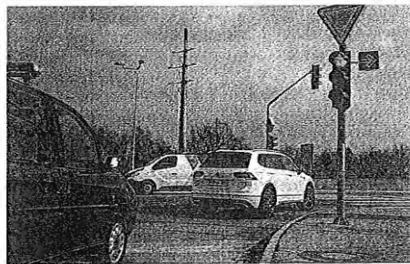
Na novi znak na Laborah se vozniki še privajajo.

Opozoriti velja še, da je zavijanje v desno ob rdeči luči omogočeno, ni pa obvezno. Če se voznik ne počuti dovolj suverena ob novem pravilu, je bolje, da počaka zeleno luč.