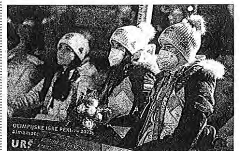
Zapisane v zgodovino slovenskega športa, od leve Gloria Kotnik, Urša Bogataj in Nika Križnar

Kranjska Gora – V Slovenski olimpijski vasi v Kranjski Gori je bil v soboto sprejem za letošnje slovenske olimpijce. Peščica gledalcev, število je bilo omejeno zaradi koronarazmer, je z bučnim aplavzom nagradila dobitnike kolajni v Pekingu, ki so se že vrnili v domovino – zmagovalko posamične tekme skakalko Uršo Bogataj in tretjevrščeno Niko Križnar, bronasto deskarko Glorio Kotnik in srebrnega Tima Mastnaka. Olimpijsko zlato je osvojila tudi mešana skakalna ekipa (Urša Bogataj, Nika Križnar, Peter Prevc in Timi Zajc), vendar Prevc in Zajc še tekmujeta in bo čas za čestitke ob prihodu v domovino.