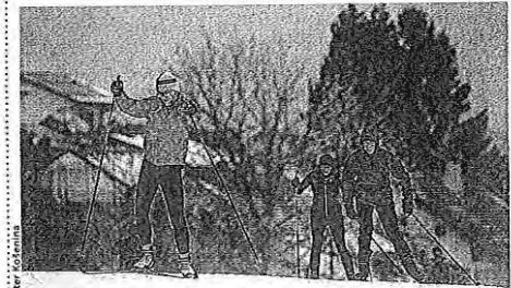
Tekaški poligon Nordijskega centra Bonovec je že ob odprtju privabil številne ljubitelje teka na smučeh.

Medvode – V soboto so odprli tekaški poligon Nordijskega centra Bonovec v Medvodah. Urejeni sta smučini za klasično in drsalno tehniko v dolžini okrog enega kilometra, progo pa bodo podaljševali skladno z vremenskimi pogoji. Poligon je odprt vsak dan od ponedeljka do sobote od 8. do 21. ure ter ob nedeljah od 8. do 17. ure. Za uporabo poligona je treba izpolnjevati pogoj PCT.