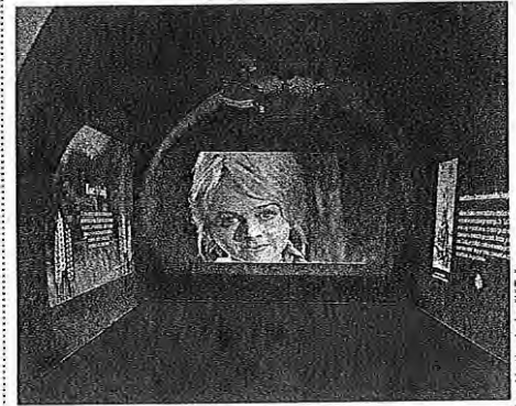
V dvorcu Visoko so uredili multimedijško sobo.

iz Tavčarjeve povesti Cvetje v jeseni, podprte z odlomki iz njene filmske upodobitve in z vsebinami iz pisateljevega zasebnega življenja, so pojasnili na občini. »Namen digitalnega invariranja te dragocene kulturne dediščine je spodbuditi razvoj turističnih produktov in storitev, povezanih s kulturo in kulturno dediščino, na osnovi uporabe naprednih tehnologij, ki bodo omogočale neposredno in izvirno turistično izkušnjo ter unikatna in globalno prepoznavna turistična doživetja ob hkratnem cilju varovanja in ohranjanja kulturne dediščine Slovenije.« V sodobno urejenem prostoru si je tako mogoče ogledati kratke odlomke iz filma Cvetje v jeseni, obenem pa spremljati življenje in delo Ivana Tavčarja.